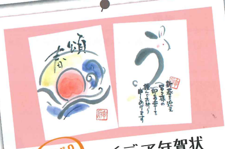
実践3 アイデア年賀状