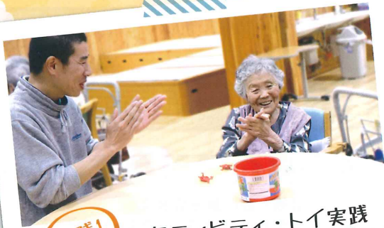
実践1 アクティビティ・トイ実践