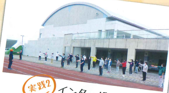
実践2 インターバル速歩