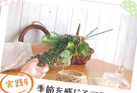
実践4 季節を感じるスワッグ